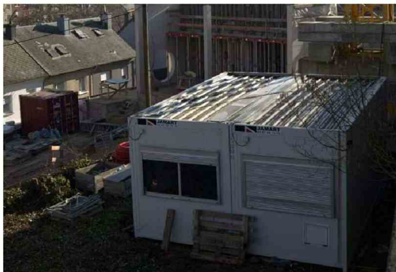
Das im Bau befindliche Nebengebäude des Albert-Hames-Hauses in der Rümelinger rue de la Bruyère

Vier weitere Projekte wird Rümelingen mit den Nachbargemeinden