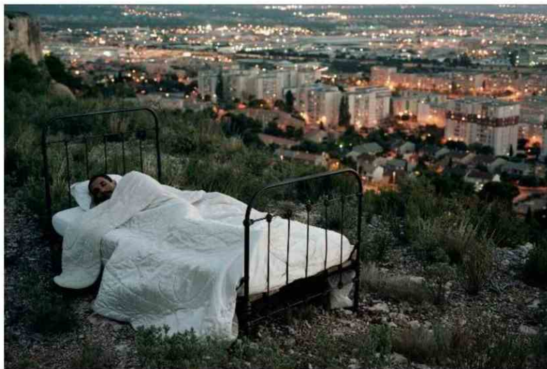
À l'occasion d'«Ekinox», des surprises autour du sommeil attendent les visiteurs.

Le Minett Tail est aussi l'occasion d'intervenir dans la Gonnerhaus, anciens bureaux administratifs des exploitations minières transformées par le bureau hsa en gîte pour randonneurs. Le Gonnerhaus fait partie des 11 projets de gîtes créés tout au long du parcours du Minett Trail et pour lesquels un concours d'architecture avait été organisé.