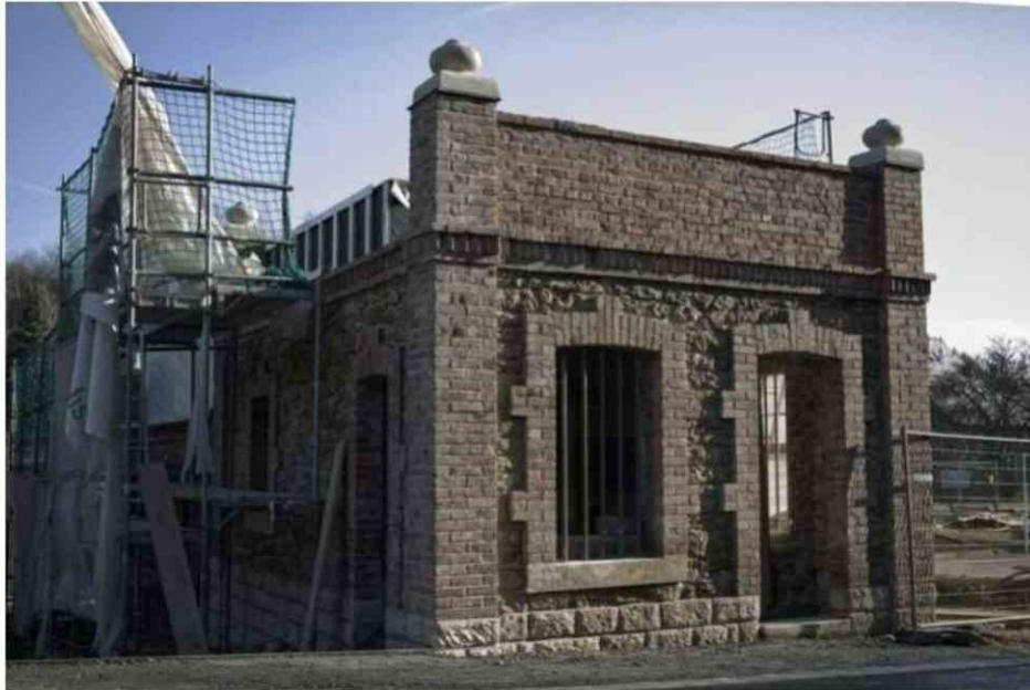
Das Gonner-Haus, ein ehemaliges administratives Gebäude, das in eine Unterkunft für Wanderer auf dem Minett-Trail umfunktioniert wird