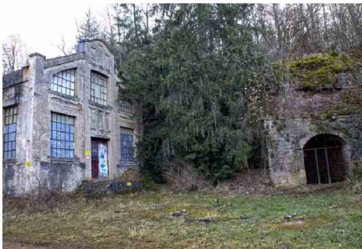
An diesem Ort könnte in wenigen Monaten das geheimnisvolle Radio CDLR-76 zu hören sein