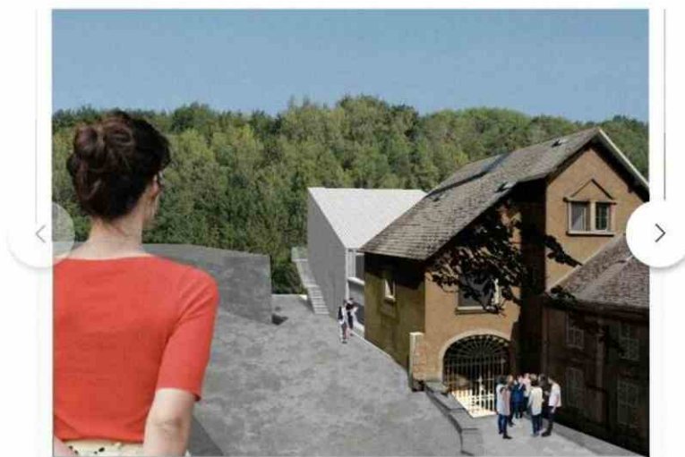
L'ancien atelier d'Albert Hames est transformé en maison d'hôte et espace créatif. (Illustration: 2001)