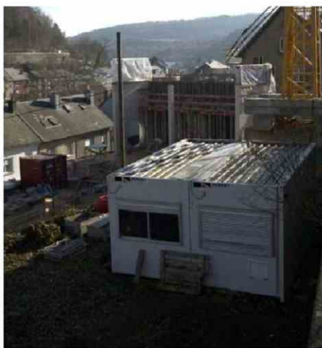
Das im Bau befindliche Nebengebäude des Albert-Hames-Hauses in der Rümelinger rue de la Bruyère