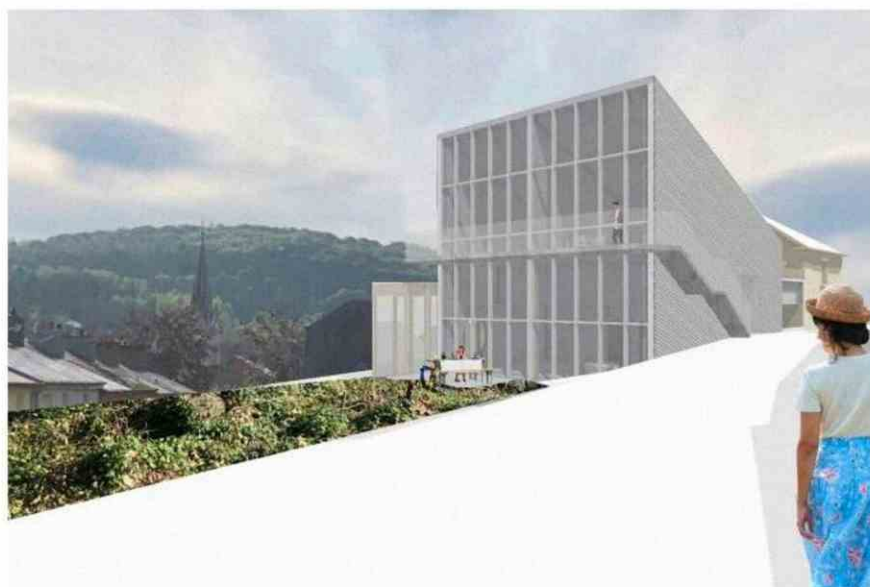
Le projet Spektrum est le projet phare de la commune de Rumelange pour Esch2022. (Illustration: 2001)