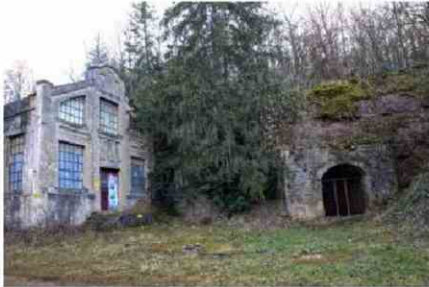
An diesem Ort könnte in wenigen Monaten das geheimnisvolle Radio CDLR-76 zu hören sein