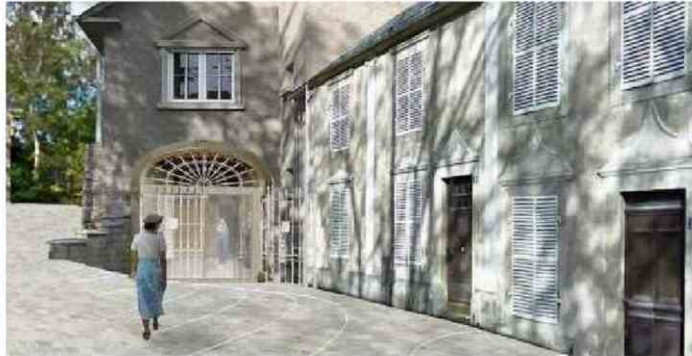
Un ancien atelier de sculpteur sera transformé à Rumelange.